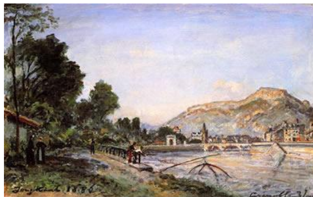
Les bords de l'Isère à Grenoble, 24 septembre 1885 - Johan-Barthold Jongkind