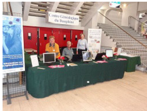
Notre stand dans l'attente des visiteurs

Nous avons participé à la 24ème édition de ce salon les 13, 14 et 15 novembre 2015 et cela, pour la 4ème année consécutive, en tant que partenaire de l'association organisatrice Ex-Libris Dauphiné.