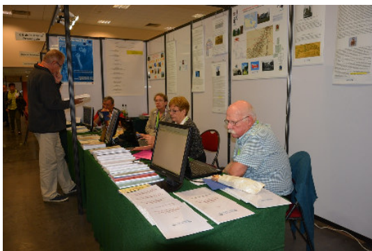
Notre stand à l'ouverture, le vendredi

Pour cette occasion nous avons réalisé la généalogie de personnages Isérois, qui ont donné leurs noms à des lieux en Nouvelle France : les familles Jarret, Paulin, Saint Ours, Sorrel, Vachon, Payan, Pécaudy.