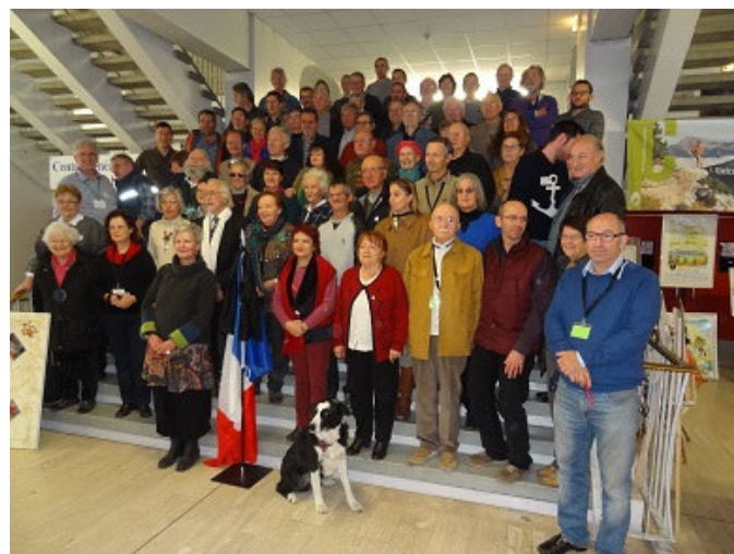
Une minute de silence a été observée