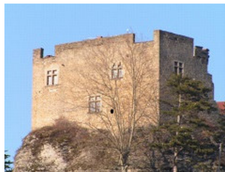
Le château delphinal