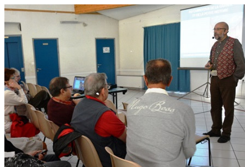
Le sourire était de circonstance

Cette journée a commencé par une conférence de Monsieur Robert Aillaud, président honoraire de l'association des amis de l'histoire du pays vizillois , sur les mémoires du docteur Basile Bonnardon, jeune médecin de Vizille et témoin du passage de Napoléon dans sa ville le 7 mars 1815, lors du fameux vol de l'Aigle .