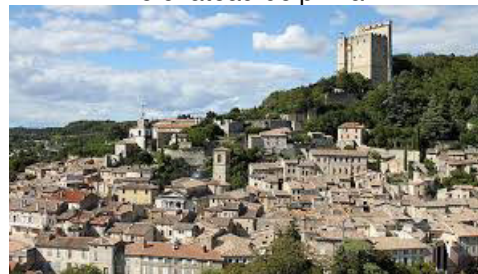
La vieille ville